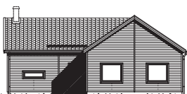
FASAD MOT ENTRÉ

Med Start 146 erbjuds ett vinkelhus som kan placeras på de flesta tomterna. Köket är husets hjärta och den öppna ytan mellan vardagsrummet, köket och matplatsen bjuder in till social samvaro. Huset har även en sovrumsdel med tre sovrum och ett separat allrum medan det större sovrummet ligger avskilt i anslutning till matplatsen. Ett hus som passar de flesta familjekonstellationerna.