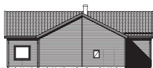
FASAD MOT VÄNSTER