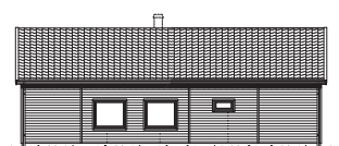
FASAD MOT HÖGER