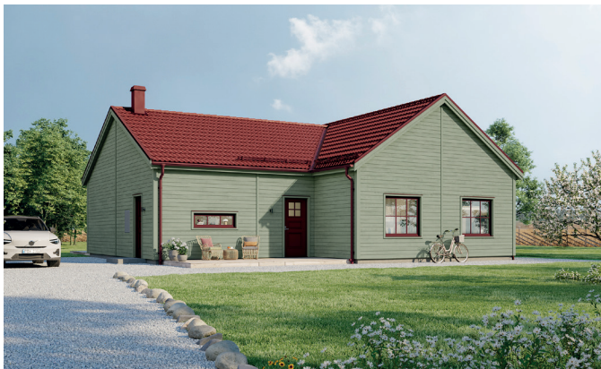
Illustrationerna visar även tillval