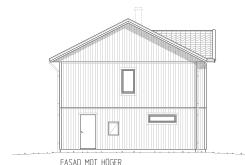
FASAD MOT HÖGER