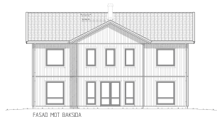
FASAD MOT BAKSIDA