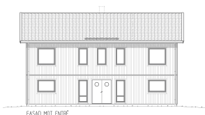
FASAD MOT ENTRÉ

Huset för dig som vill ha extra allt. Generös boarea på två tjusiga våningar. Kliv in i den stora entrén med rymlig klädkammare. På entréplan smälter kök, matplats och vardagsrum ihop i ett. I andra änden kan du bygga till ett bibliotek eller gästrum med klädkammare (eller hemligt lönnrum!). Den centralt placerade trappan ger flexibel rundgång, och leder upp till plan två som rymmer fyra sovrum och ett generöst allrum. Här kan du välja till fransk balkong med fönsterpardörr. Föräldrasovrummet har inbyggd garderob, stor klädkammare och badrum i nära anslutning med möjlighet till både dusch och badkar. Vill du maxa huset ännu mer? Välj till valmat tak och entrétak, frontespis med dekorfönster på gavelspetsarna och extra fönsterpardörrar vid kök och matplats.