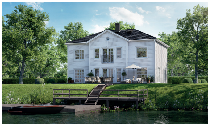
Illustrationerna visar även tillval

Huset för dig som vill ha extra allt. Generös boarea på två tjusiga våningar. Kliv in i den stora entrén med rymlig klädkammare. På entréplan smälter kök, matplats och vardagsrum ihop i ett. I andra änden kan du bygga till ett bibliotek eller gästrum med klädkammare (eller hemligt lönnrum!). Den centralt placerade trappan ger flexibel rundgång, och leder upp till plan två som rymmer fyra sovrum och ett generöst allrum. Här kan du välja till fransk balkong med fönsterpardörr. Föräldrasovrummet har inbyggd garderob, stor klädkammare och badrum i nära anslutning med möjlighet till både dusch och badkar. Vill du maxa huset ännu mer? Välj till valmat tak och entrétak, frontespis med dekorfönster på gavelspetsarna och extra fönsterpardörrar vid kök och matplats.