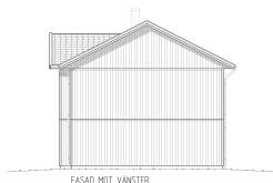
FASAD MOT VÄNSTER