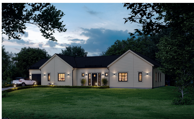
Illustrationerna visar även tillval

Det här stora enplanshuset i spännande H-form delar hemmet i två delar – som låter sig förenas i en välbalanserad helhet med matplats och kök som mittpunkt. Entrén med kapprumsdel är på en gång funktionell och inbjudande. I husets ena del kan barnen få en hel flygel för sig själva med fyra sovrum, badrum och gemensamt allrum. På andra sidan finns det luftiga vardagsrummet och föräldrasovrummet med närhet till både badrum och gedigen klädvård. Välj till kopplat garage för en smart ingång till klädvården! Gillar du storslaget kan du också välja till ryggåstak i vardagsrummet fönster i gavelpetsarna.