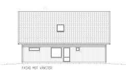
FASAD MOT VÄNSTER