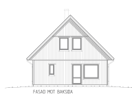
FASAD MOT HÖJDER