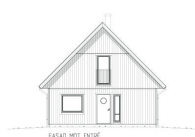
FASAD MOT ENTRÉ

Med entrén placerad på husets gavel passar LB Optimal 138 fint också på smalare tomter. Två separata fönsterdörrar i vardagsrummet gör det dessutom möjligt att anpassa läget för uteplatsen efter tomtens form och förutsättningar – var är kvällssolen? Huset har en modern fönstersättning och får ljus och rymd genom en delvis öppen planlösning mellan kök och vardagsrum. Det är ett praktiskt hus med fyra sovrum på optimerad yta, stor klädvårdsdel, kapprum vid entrén och gott om förvaringsmöjligheter. Här får du också vardagslyxiga detaljer som fransk balkong i master bedroom och inbyggd nisch för din tv-möbel i vardagsrummet.