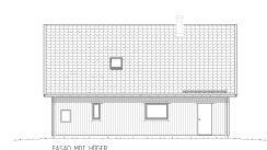
FASAD MOT HÖJDER