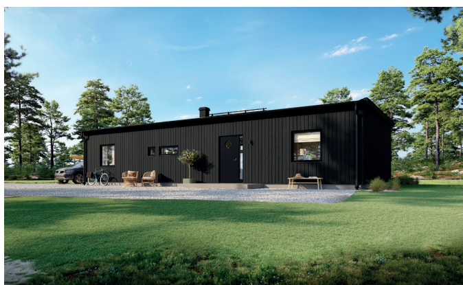
Illustrationerna visar även tillval

Ett hem för det moderna hushållet. Här ramar överskjutande tak och väggar in baksidan och ger både ett originellt uttryck och vindskyddad uteplats. Baksidans stora fönsterparti får kök och vardagsrum att bada i solljus. I köket ingår praktisk köksö. Välj till eldstad med central placering – för att på bästa sätt ta vara på värmen. De fyra sovrummen är placerade i varsin ände, det största med egen klädkammare. I sin nätta och välplanerade modell passar den här enplansvillan bra även som fritidshus. För ytterligare ljusinsläpp kan du välja till parallelltak med extra fönster ovanpå baksidans ursprungliga fönster.