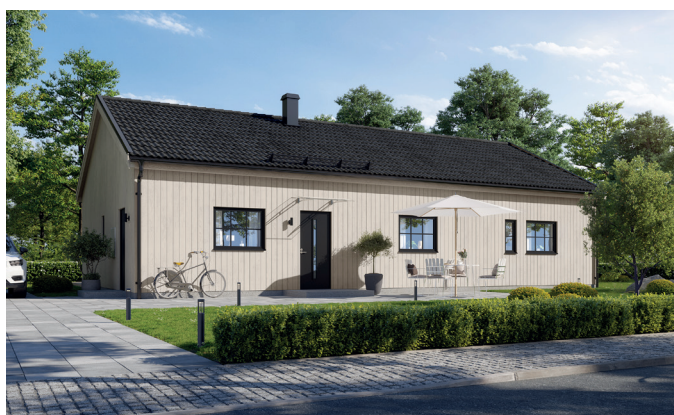
Illustrationerna visar även tillval

Ett hem med funktion och flexibilitet i topp - på en behagligt kompakt boyta som tillåter både närhet och avskildhet. Den öppna planlösningen i husets mitt ger en lugn överblick och knyter med stora fönster an insida med utsida. Inbyggt skafferi och gott om utrymme i köket är som bäddat för storhandling och rykande härliga middagar. När de små vill dra sig undan ha de sitt eget mysiga krypin i ena delen. Och i den andra, det lyxiga föräldrarsovrummet med egen wc/dusch. Utomhus är pricken över i det stora taket med fria ytor som möjliggör egenproducerad el med solpaneler.