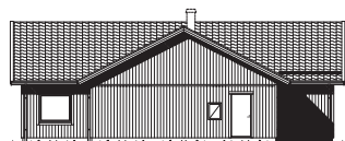
FASAD MOT VÄNSTER