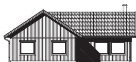
FASAD MOT BAKSIDA