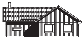
FASAD MOT ENTRÉ

Det här vinkelhuset passar de flesta tomter – och familjekonstellationer. Här är det stora sovrummet avskilt i ena änden av huset, med egen klädkammare och badrum. I andra änden finns ytterligare tre sovrum och gemensamt allrum för lekstunder och myskvällar. Köket är husets centrum, och ansluter till det rymliga vardagsrummet med matplats i vinkel och altandörr som ger en naturlig koppling till baksidan. Tillvalda fönster från golv till tak, eller pampigt ryggåstak i vardagsrum, ger extra öppenhet. Den egna tvättstugan har en rejält tilltagen klädkammare med skjuddörrsparti. Välj till kopplat garage med ingång direkt till tvättstugan – särskilt tacksamt under regniga dagar.