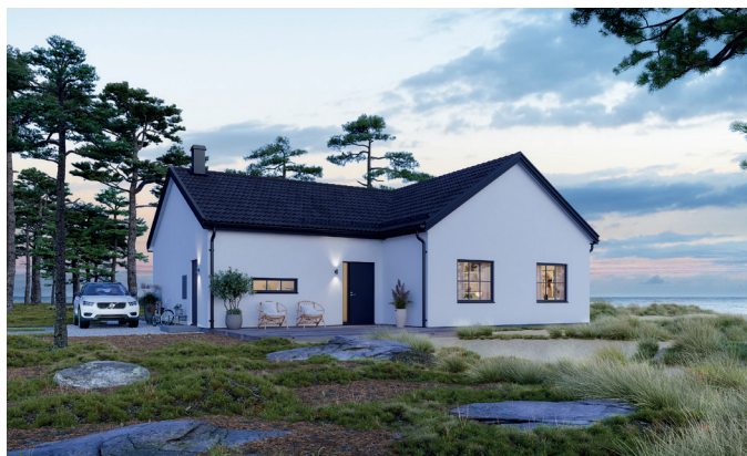
Illustrationerna visar även tillval

Det här vinkelhuset passar de flesta tomter – och familjekonstellationer. Här är det stora sovrummet avskilt i ena änden av huset, med egen klädkammare och badrum. I andra änden finns ytterligare tre sovrum och gemensamt allrum för lekstunder och myskvällar. Köket är husets centrum, och ansluter till det rymliga vardagsrummet med matplats i vinkel och altandörr som ger en naturlig koppling till baksidan. Tillvalda fönster från golv till tak, eller pampigt ryggåstak i vardagsrum, ger extra öppenhet. Den egna tvättstugan har en rejält tilltagen klädkammare med skjuddörrsparti. Välj till kopplat garage med ingång direkt till tvättstugan – särskilt tacksamt under regniga dagar.