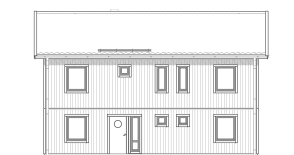
FASAD MOT ENTRÉ

Det här är vårt största hus. Det är rymligt, ljust, välplanerat och perfekt för det stora hushållet. Här finns gott om praktiska förvaringsmöjligheter och stora, ljusa sällskapsytor med öppen planlösning. Den rymliga hallen ger bra utrymme för förvaring och som tillval finns även möjlighet till ett extra förvaringsutrymme under trappan. Huset har fem sovrum, alla med fönster åt två håll. Dessutom finns möjlighet till ytterligare ett sovrum, om du delar av allrummet. Vinkeln skapar en trevlig och ombonad innergårdskänsla på uteplatsen och du kan välja till New England-veranda längs med fasaderna. Separat klädvård ingår som standard.