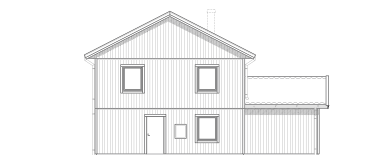
FASAD MOT HÖGER