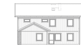
FASAD MOT BAKSIDA