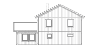
FASAD MOT VÄNSTER