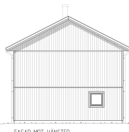
FASAD MOT VÄNSTER