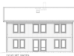
FASAD MOT BAKSIDA