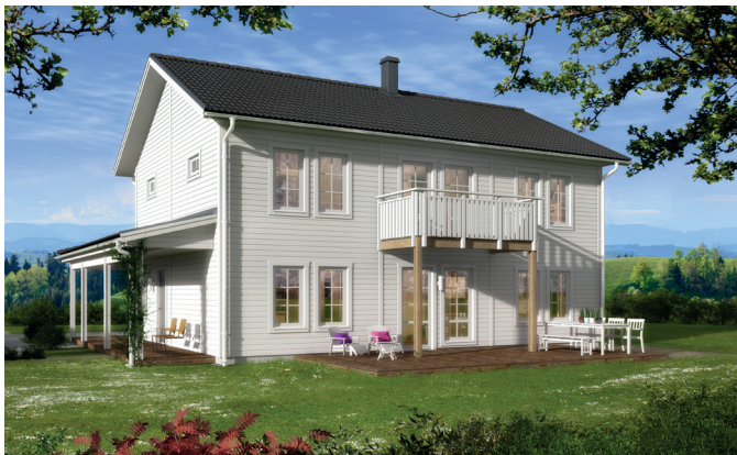
Illustrationerna visar även tillval

Det här är ett rymligt och välplanerat hus för det stora hushållet. Den klassiskt symmetriska utformningen gör att huset passar fint i de flesta omgivningar. Här finns gott om praktiska förvaringsmöjligheter och stora, ljusa sällskapsytor med öppen planlösning. Den rymliga hallen är en av husets mest uppskattade egenskaper och som tillval finns bland annat praktisk klädkammare under trappan och balkong på fram- och baksida. I det här huset finns hela fyra sovrum och möjlighet att välja till fler, alltså finns det gott om plats för familjen att växa. Arbetsrum blir barnkammare, som blir tonårsrum och till sist kanske ett bibliotek?