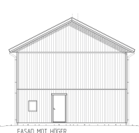
FASAD MOT HÖGER