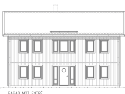
FASAD MOT ENTRÉ

Det här är ett rymligt och välplanerat hus för det stora hushållet. Den klassiskt symmetriska utformningen gör att huset passar fint i de flesta omgivningar. Här finns gott om praktiska förvaringsmöjligheter och stora, ljusa sällskapsytor med öppen planlösning. Den rymliga hallen är en av husets mest uppskattade egenskaper och som tillval finns bland annat praktisk klädkammare under trappan och balkong på fram- och baksida. I det här huset finns hela fyra sovrum och möjlighet att välja till fler, alltså finns det gott om plats för familjen att växa. Arbetsrum blir barnkammare, som blir tonårsrum och till sist kanske ett bibliotek?