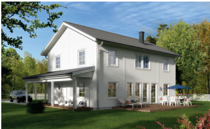
Illustrationerna visar även tillval

Det här är ett rymligt, ljust och välplanerat hus, perfekt för det stora hushållet. Stora, ljusa sällskapsytor kombineras med yteffektivt tänk och gott om förvaringsmöjligheter. Med hela fem sovrum och möjligheten att dela av allrummet till ytterligare ett sovrum, är huset lätt att anpassa allt eftersom hushållet ändrar storlek. Alla sovrum har fönster åt två håll och för den som vill gå huset att få med New England-veranda längs med fasaderna. Separat klädvärd ingår som standard.