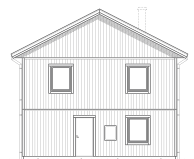
FASAD MOT HÖGER