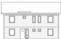
FASAD MOT ENTRÉ

Det här är ett rymligt, ljust och välplanerat hus, perfekt för det stora hushållet. Stora, ljusa sällskapsytor kombineras med yteffektivt tänk och gott om förvaringsmöjligheter. Med hela fem sovrum och möjligheten att dela av allrummet till ytterligare ett sovrum, är huset lätt att anpassa allt eftersom hushållet ändrar storlek. Alla sovrum har fönster åt två håll och för den som vill gå huset att få med New England-veranda längs med fasaderna. Separat klädvärd ingår som standard.