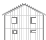
FASAD MOT VÄNSTER