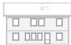
FASAD MOT BAKSIDA