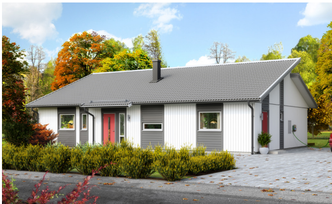
Illustrationerna visar även tillval

Det här är ett hus med smart planlösning och välutnyttjade ytor. Pulpettaket och fönstrens placering ger ett modernt intryck och ett fint flöde av det viktiga ljuset. Här finns många möblerbara väggar och mycket goda förvaringsmöjligheter. En egen avdelning för barn och gäster, de generösa sällskapsytorna och WC/dusch i anslutning till master bedroom, är exempel på ytterligare plus. I tillvalsutbudet hittar du ryggåstak i vardagsrum, tak över uteplats, ett extra sovrum i allrumsdelen, bastu och mycket mer.