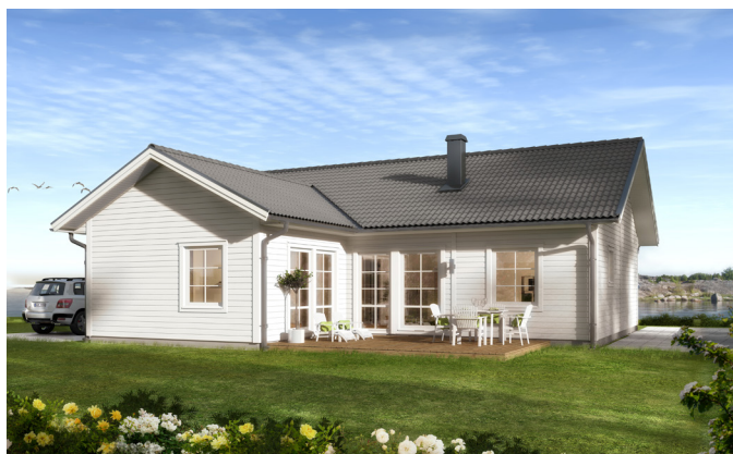
Illustrationerna visar även tillval

Det här är ett stort litet hus, som passar perfekt för det mindre hushållet. Det är yteffektivt och har stora, ljusa sällskapsytor, öppen planlösning och gott om förvaringsmöjligheter. Med vardagsrummet i vinkel får du en trevlig och ombonad innergårdskänsla på uteplatsen. Vill du ha mer rymd finns ryggåstak som tillval. Huset passar också fint som sommarboende med året-runt-standard.