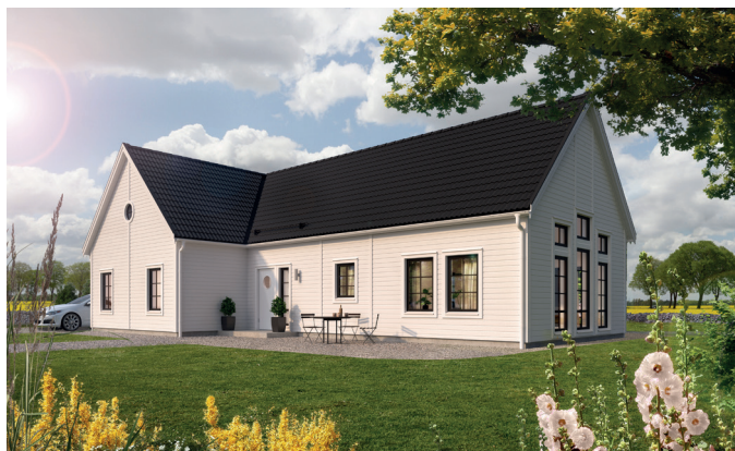
Illustrationerna visar även tillval

Det här är huset med stort "H" för dig som vill ha gott om plats för både fester och vardagsliv. Med stort master bedroom med egen wc/dusch och klädkammare, separat barndel med eget allrum, rejäl yta för vardagsrum/matplats och massor med förvaringsmöjligheter i klädvårdsdelen, är så gott som hela önskelistan avklarad. Husets sällskapsytor badar i ljus tack vare generösa fönsterpartier och såväl kök som vardagsrum har kontakt med både framsidan och den vindskyddade baksidan. Bland tillvalen hittar du ryggåstak i vardagsrum med fönsterpaket och takfönster.