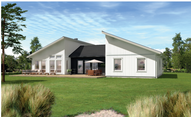
Illustrationerna visar även tillval

Det här mångas drömhus, både när det kommer till planlösning som estetik. Det stilrena och strikta utförandet gör att det passar fint i alla slags miljöer och h-formens vinklar ger såväl skyddade uteplatser som spännande rumsytor interiört. Huset präglas av stora, ljusa sällskapsytor, öppen planlösning och gott om förvaringsmöjligheter. Husets master bedroom har egen klädkammare och badrum och ligger avskilt från de tre mindre sovrummen. Här finns en stor hall och ett rejält klädvårdsutrymme vid entrén. Pulpettaket bidrar till det strikta utseendet och det här huset är perfekt för dig som vill ha en riktig nyfunkisstil.